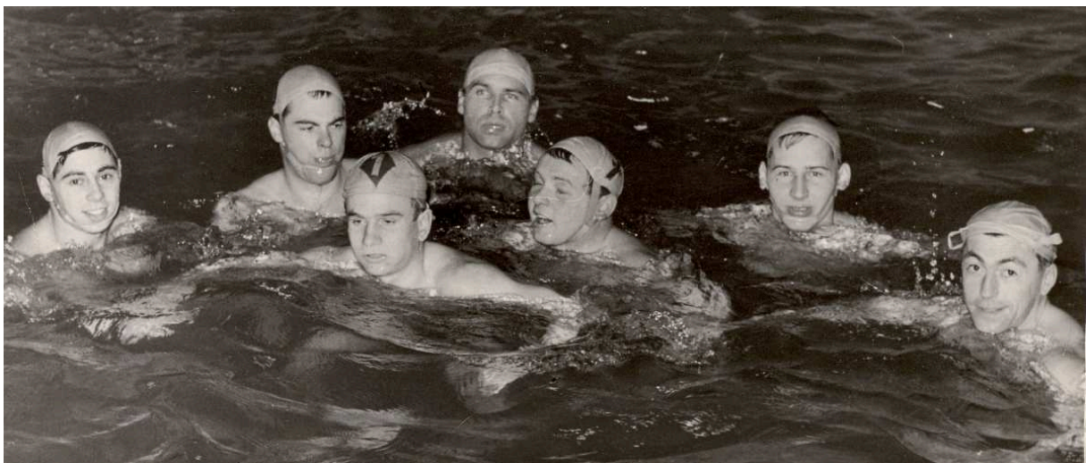
Vizemeister Staatsliga 1956 – 1961