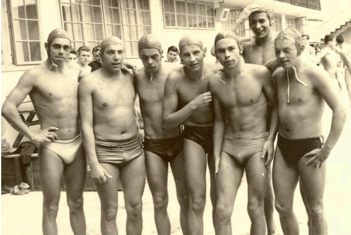
Vizemeister Jugend 1955

18 Jahre en suite gewinnen die Wasserballer der Schwimmunion Wien in den 50er und 60er Jahren die österreichischen Nachwuchs und Staatsmeistertitel. Dem LSK und unserem Obmann bleibt es in dieser Zeit also vorbehalten sich mit 9 Vizemeistertiteln und drei Drittplatzierungen zu begnügen.