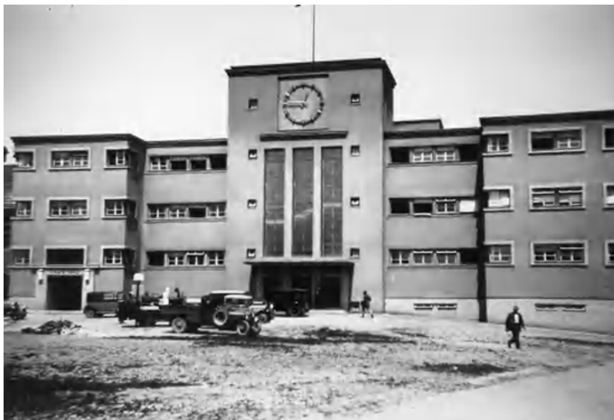
Linzer Parkbad 1936