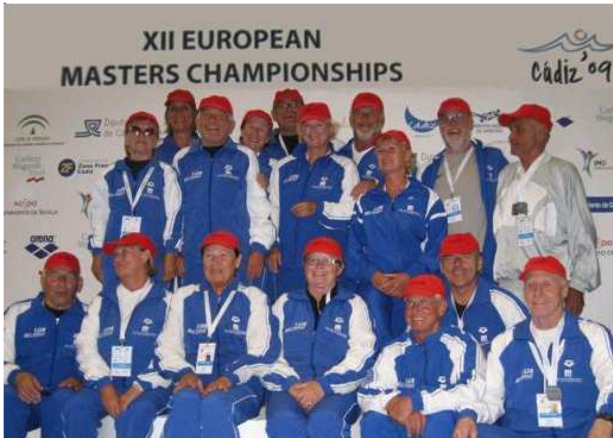
Europameisterschaft der Masters 2009, Cadiz, Spanien